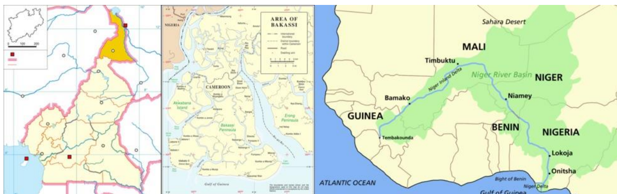
Рис. 1. Крайнесеверный регион Камеруна (справа), полуостров Бакасси и дельта Нигера (слева)

Самыми уязвимыми для терроризма территориями в Камеруне являются Крайнесеверный регион (Рис. 1), окрестности полуострова Бакасси и морская часть территории, соединяющая Камерун с дельтой Нигера, подверженная угрозе пиратства. Восточная часть Камеруна также стала территорией риска в связи с гражданской войной в Центральноафриканской Республике. Таким образом, террористическая угроза распространяется на границы между Камеруном и Нигерией, Чадом и ЦАР.